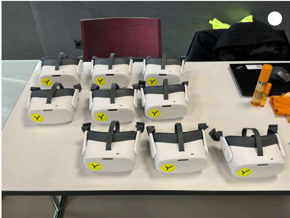
Virtual Reality Brillen stehen für die Schülerinnen und Schüler bereit.