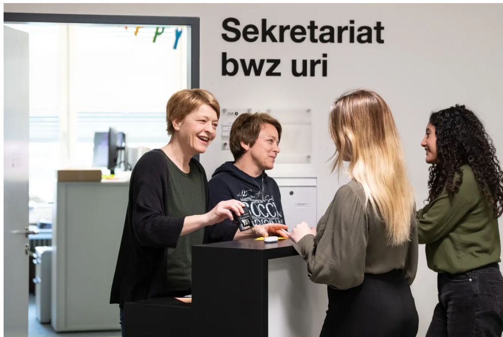
Auch das Sekretariat des BWZ Uri schloss bei der Schülerumfrage gut ab.